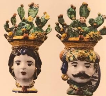
LES FIGURES SICILIENNES Vases figuiers de barbarie en forme de têtes de maures en céramique peinte. Fico d'India , 250 € la paire, VÉRONIQUE MASSUGER GALERIE.