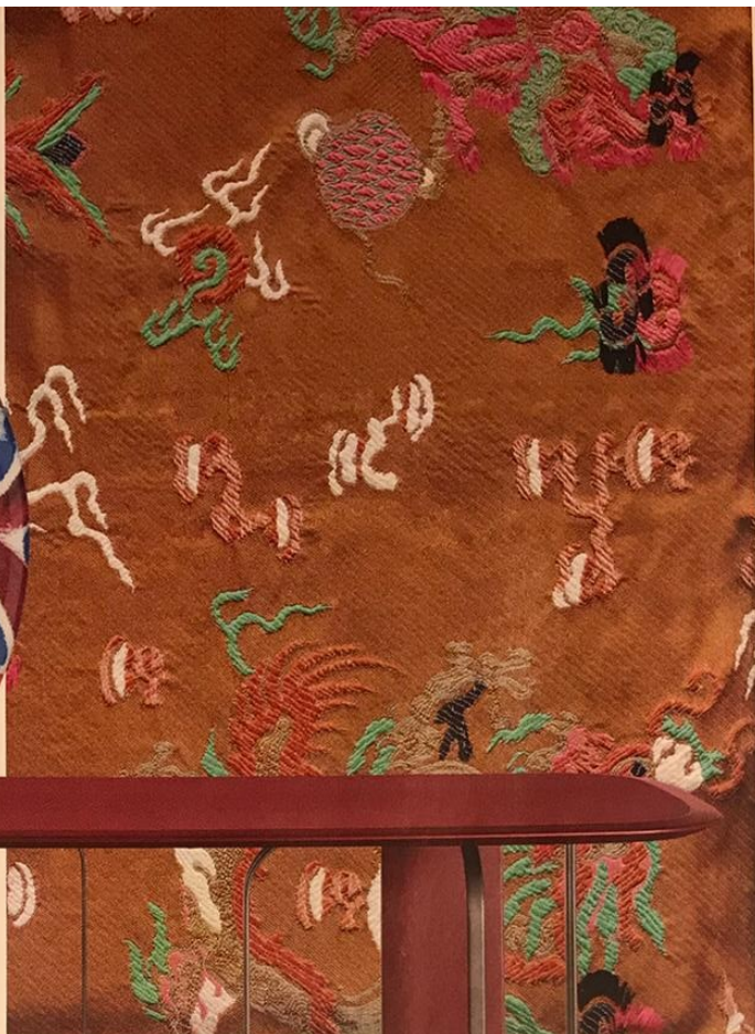
LE JACQUARD PRÉCIEUX Des dragons amusants animent ce luxueux brocart de soie inspiré des kimonos. Scaramouche , 72 x h 99 cm, 380 €, DEDAR.