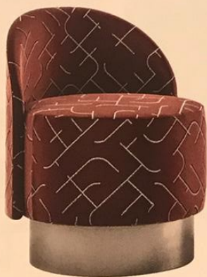
L'ASSISE GLAMOUR Imaginée par le tandem milanais Studiopepe, habillée ici d'un tissu Dedar, elle nous enveloppe de douceur. Pastille , 1 57 x h 73 x p 55 cm, à partir de 1081 €, TACCHINI chez SILVERA.