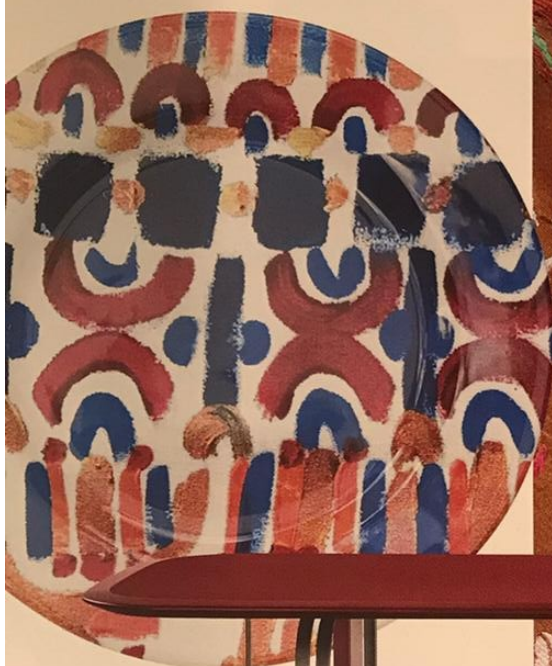
L'ASSIETTE SARDE Elle est en céramique, motif peint à la main et imprimé. cp0015b , ø 25cm, 34 €, LE BOTTEGHE SU GOLOGONE.